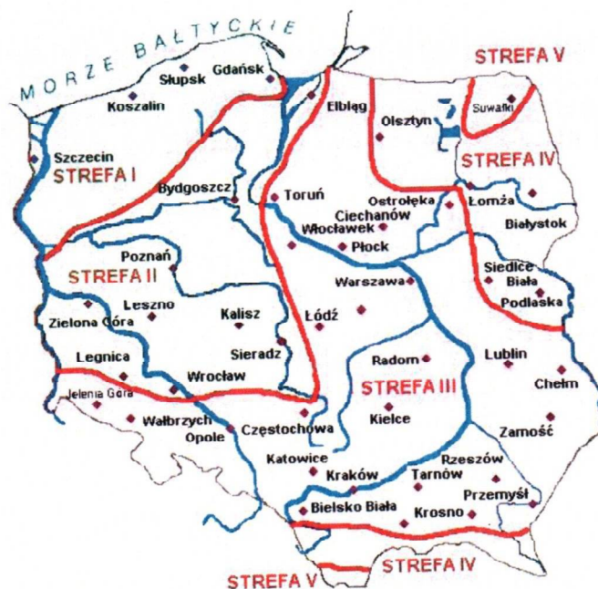
Rys. 1 Strefy klimatyczne Polski i temperatury obliczeniowe

Położenie obiektu, w którym planowany jest montaż, na mapie ma wpływ na pracę instalacji oraz na dobór mocy projektowanego kotła. W zależności od współrzędnych geograficznych rozbieżności w temperaturach projektowych mogą mieć znaczącą wartość i wpływ na zapotrzebowane na ciepło w budynku. W skali kraju ilustruje to poniższa mapa (Rys.1).